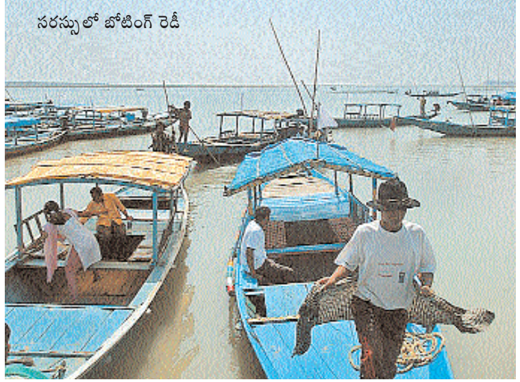
సరస్సులో బోటింగ్ రెడీ

ఐ.ఎన్.ఎన్. చిల్క చేరడానికి ముందే విష్ణువు కొలువుండే 'నారాయణి' గుడిని చూశాం. మధ్యాహ్నం ఒంటిగంటకి చిల్క సరస్సు చేరాం. అల్పంత దూరంలోనే ఆకు పచ్చని జలరాశిని చూడగానే హృదయం ఆనందంతో గంతులు వేసింది. అక్కడ ఉన్న ఒక రెస్టారెంట్ లో భోజనం చేశాం. దేశ విదేశాల టూరిస్టులతో కోలాహలంగా ఉంది. బంగాళాదుంపల వేపుడు, పుట్ట గొడుగుల కూర నోటికి కొత్తగా, రుచిగా అనిపించాయి. మా అయిదుగురితోపాటు ఇంకో అయిదుగురు టూరిస్టులను కలుపుకుని సరస్సుపై విహారానికి బోటు మాట్లాడుకున్నాం. సరస్సు మధ్యన పక్షులు విడిదిచేసే చోటు, కాళీజై గుడి వున్న ఐలెండ్ చూపించడానికి 1100 రూ:లు తీసుకున్నారు. సరస్సు ఒడ్డున అనేక రకాల పడవలు చూశాం. 'ఫ్లోటింగ్ రెస్టారెంట్' పడవ కొత్తగా వుంది. అన్నింటికన్నా అందంగా, రీవిగా బంతిపూలతో అలంకరించిన 'లతిక' హాసింగ్ బోట్ అందరినీ ఆకర్షించింది. ఒరిస్సా టూరిజం డెవలప్ మెంట్ కార్పొరేషన్ (OTDC) వారిచేత 'లతిక' నడవబడుతోంది. 2.10 గం:కి మేమెక్కిన బోటు బయల్దేరింది. 3.30కల్లా పక్షులు విడిది చేసే చోటుకు చేరుకుంది. అనుకున్న స్థాయిలో పక్షులు లేవు. అక్కడక్కడా గుంపులుగా ఎగిరిన పక్షుల్ని, నీటిమీద కాగితం పడవల్లా తేలుతున్న పక్షుల్ని చూసి సంతోషపడ్డాం. ఈ సీజన్ లో ఉక్రెయిన్, సైబీరియా లాంటి ప్రాంతాల నుంచి 4,000 కిలోమీటర్ల మేర దూరం పక్షులు అవిశ్రాంతంగా ఎగురుతూ ఇక్కడికి వస్తాయని తెలిసింది. మామూలుగా చిల్క సరస్సు లోతు 50, 60 అడుగులు వుంటుంది. కానీ పడవ ఆగిన దగ్గర 12 అడుగుల లోతు మాత్రమే వుంది. పడవ అంచున కూర్చుని పాదాలు నీళ్ళలోకి జారవిడిచినప్పుడు బుల్లిబుల్లి చేప పిల్లలు కాళ్ళకి తగిలి గిలిగింతలు పెట్టాయి. అడుగున వున్న నాచు మూలంగా సరస్సు